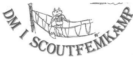
Bild 6 DM i ScoutFemKamp