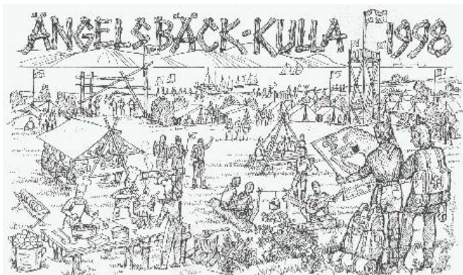
Bild 5 Ängelsbäck

Den 25 juli-1 augusti åker 30 stycken på distriktets sommarläger Ängelsbäck-98. Trots dåligt väder trivdes alla.