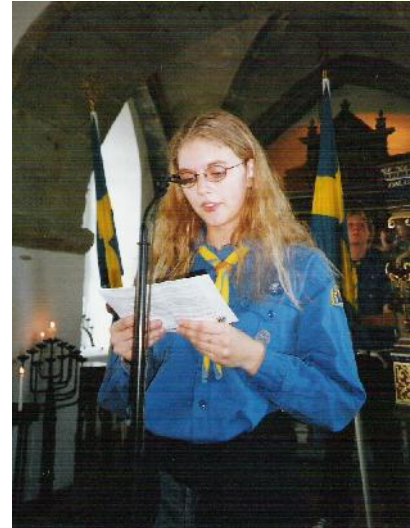
Bild 4 St Georg i Välluvs Kyrka

På det andra aprilmötet diskuterade man märken och ändrade ansvarsfördelning av materialförvaltandet.