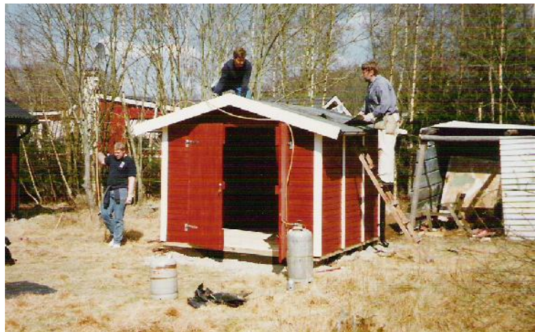
Bild 2 Bygge av den nya ved- och redskapboden på Grankulla

Kåren genomför en klistring för Koloriten den 3 maj på scoutlokalen. Den 10 maj arrangerar båveravdelningen en familjedag på Grankulla i dåligt väder för sju familjer. Kåren deltagar med 56 stycken på årets Pingstläger den 17-19 maj.