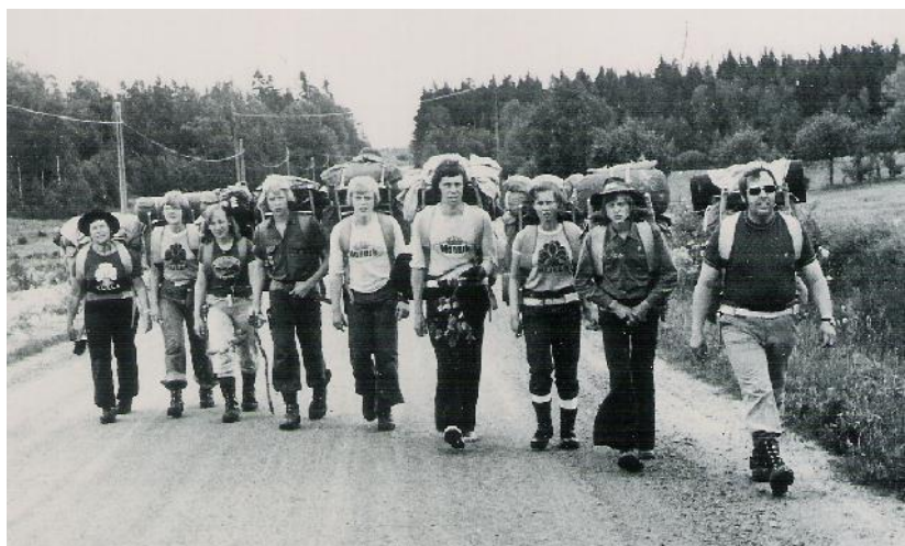
Bild 7 Seniorscouterna på Kjesäterleden