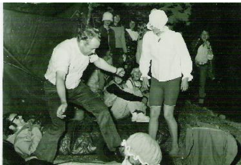
Bild 5 Lägerbålspej på kårläget 1974