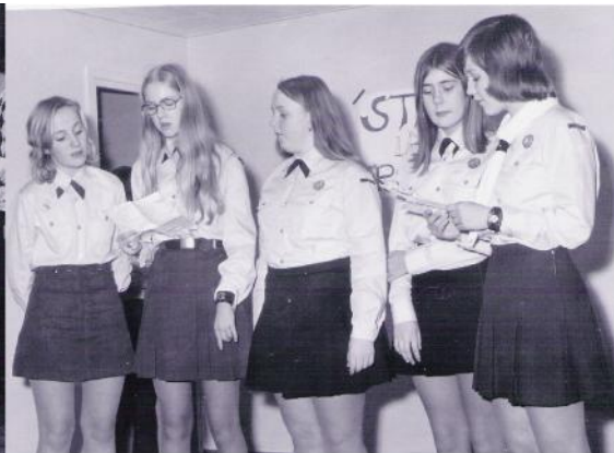
Bild 3 Seniorflickorna den 23 februari 1973

Kåren beslutar att dela upp juniorscout-avdelningen i två avdelningar under vårterminen. Den 30 mars beger sig 6 ledare på distriktets kurs "Pejling" i Helsingborg. Den 30 mars-1 april beger sig fem seniorscoutar ut på en hajk. Den 31 mars beger sig miniorscouterna till Frams stuga på en skogsutflykt. Man beslutar på mars månads möte att Kullatröjan endast får användas som arbetströja.