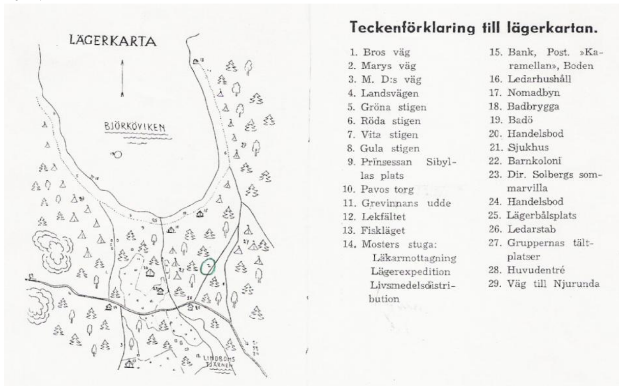
Bild 4 Lägerkarta från Björkö.