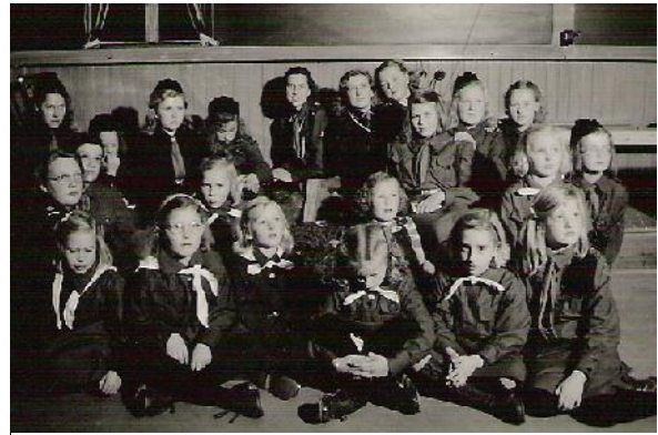
Bild 5 Flickscoutupptagningen den 5 december.